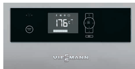
Regulacija Ecotronic 100 z osvetljenim zaslonom za preprosto in intuitivno upravljanje

Šele pri ekstremno nizkih zunanjih temperaturah se doklopi konvencionalni kotel za pokrivanje potrebnega vršnega bremena.