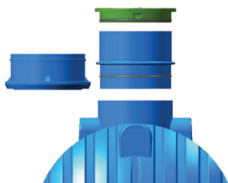
Nadgradnja revizijske odprtine z obroči ali teleskopskimi podaljški