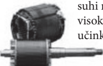
suhi motor visoke učinkovitosti